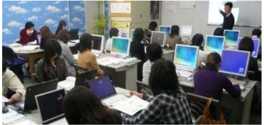
富士通オープンカレッジ宇都宮校 授業風景